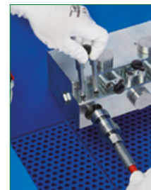
ADAPTORS WITH QUICK COUPLING ADATTATORE CON INNESTO RAPIDO BC 1200/E ES