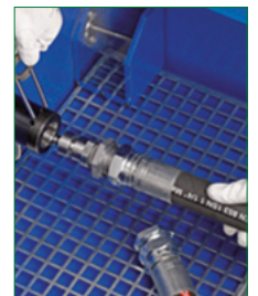
ADAPTORS WITH QUICK COUPLING ADATTATORE CON INNESTO RAPIDO BC 1200/E

Product specifications could be modified without prior notice. Le specifiche dei prodotti potrebbero essere modificate senza preavviso.